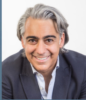
Marco Enríquez- Ominami