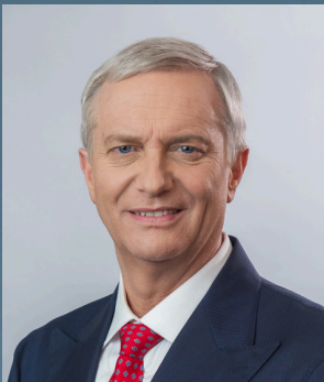
José Antonio Kast