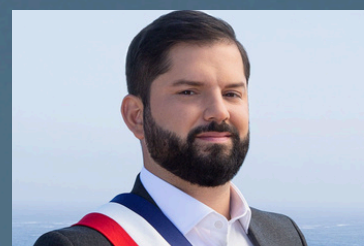
Gabriel Boric (*) Presidente de la República