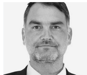
JAVIER MACAYA Senador