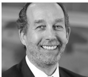
REDUCCIÓN DE LISTAS DE ESPERA QUIRÚRGICAS PAUL SCHIODTZ Presidente de ACHS