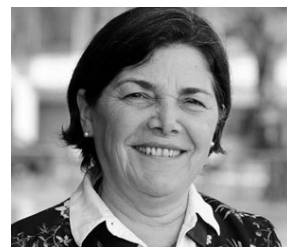
RECONSTRUCCIÓN Y COLABORACIÓN SIN PREJUICIOS PAULINA SABALL Delegada Presidencial para la Reconstrucción