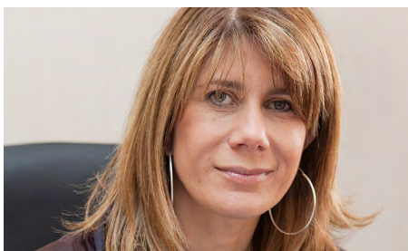
SENADORA XIMENA RINCÓN