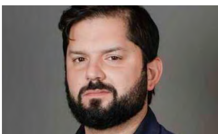
PRESIDENTE ELECTO DE LA REPÚBLICA, GABRIEL BORIC