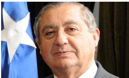
MINISTRO JUAN EDUARDO FUENTES

Presidente de la Cámara de Diputadas y Diputados