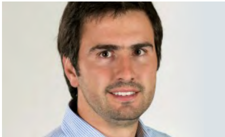
DIPUTADO DIEGO PAULSEN

Presidente de la Cámara de Diputadas y Diputados