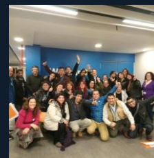
Taller de Liderazgo Inclusivo