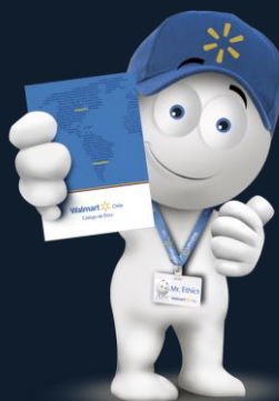
Entrenamiento On line Ética