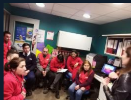
Capacitaciones en Locales