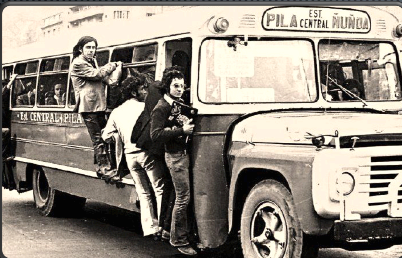
Santiago a fines de los 70